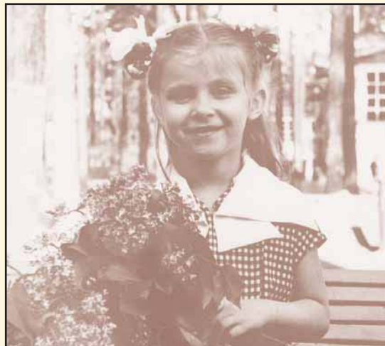
День рождения, 6 лет