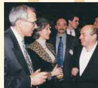
С министром промышленности и торговли Израиля Натаном Шаранским. 1998

Уверена, что наши граждане должны посещать американские, японские, израильские конгрессы: именно на них развиваются самые современные идеи качества. Необходимо видеть, куда движется этот мир