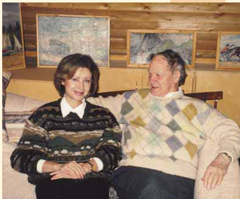
С академиком С.П. Капицей, Николина Гора. 2003